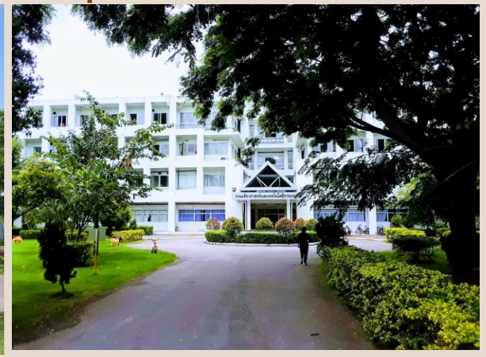
ภาพสถานที่ คณะสัตวศาสตร์และเทคโนโลยีการเกษตร มหาวิทยาลัยศิลปากร วิทยาเขตสารสนเทศ เพชรบุรี